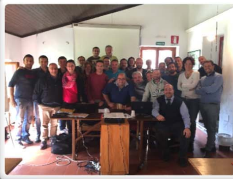
GOVERNANCE AVVISO 5-2015 FONDIMPRESA