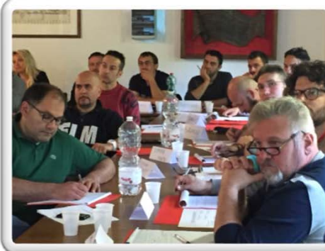
FORMAZIONE CONGIUNTA URGENZA ASSOLUTA